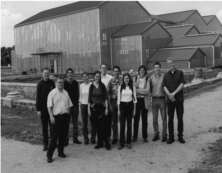
› vor dem Archäologischen Museum in Xanten, vermutlich 2001