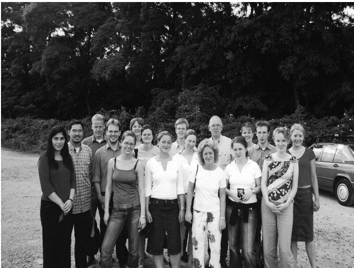
› Exkursion im Jahre 2003