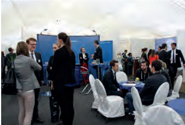
JurStart 2016 | Foto: Farah Forootan

teil und bieten den Studierenden aller Semester, Examensabsolventen, Referendaren und Berufseinsteigern relevante Informationen zu Bewerbung, Beruf und Karriereplanung. Die „JurStart/LLM Fair Europe“ ist die größte Messe ihrer Art an einer rechtswissenschaftlichen Fakultät in Deutschland.