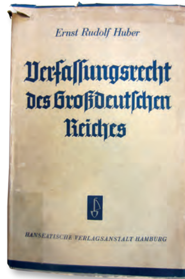
Verfassungsrecht des Großdeutschen Reiches

„Das lebendige völkische Recht wird im Volke in erster Linie durch den Führer verwirklicht, und der rechtsprechende Richter des neuen Reiches ist notwendig dem Führerwillen, der eben Ausdruck des höchsten Rechts ist, untergeordnet.“ (S. 278f.)